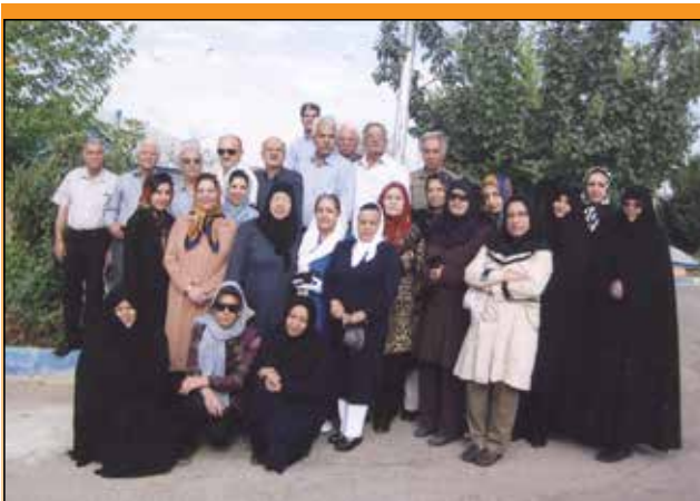
عکس فوق مربوط به گروهی از بازنشستگان و همکاران در اردوگاه جادگان فارس می باشد.